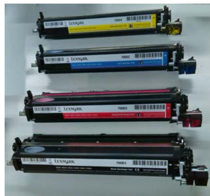
Entwicklereinheiten: Yellow, Cyan, Magenta, Black