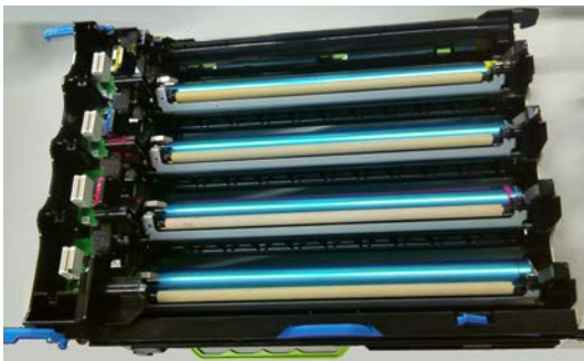
Fotoleitereinheit (vier Fotowalzen)

z.B. Farblaser CX 410: (der Belichtungs kit besteht hier aus zwei Einheiten)