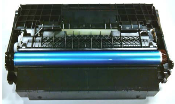
Rückansicht (ACHTUNG: „blaue“ Fotowalze ist empfindlich !!! NICHT BERÜHREN !!!)

z.B. Farblaser CX 410: (der Belichtungs kit besteht hier aus zwei Einheiten)